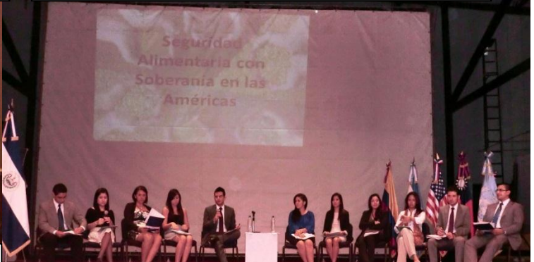
Conferencistas. Estudiantes que participaron XXX Modelo de la Asamblea Gral. De la Organización de Estados Americanos, MOEA, representando a Saint Kitts and Nevis en Cochabamba Bolivia.