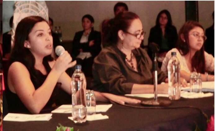
Mesa de Honor, integrada por Conferencistas, Tema expuesto: "El papel de la mujer en el cumplimiento de los Objetivos del Desarrollo del Milenio, ODM.